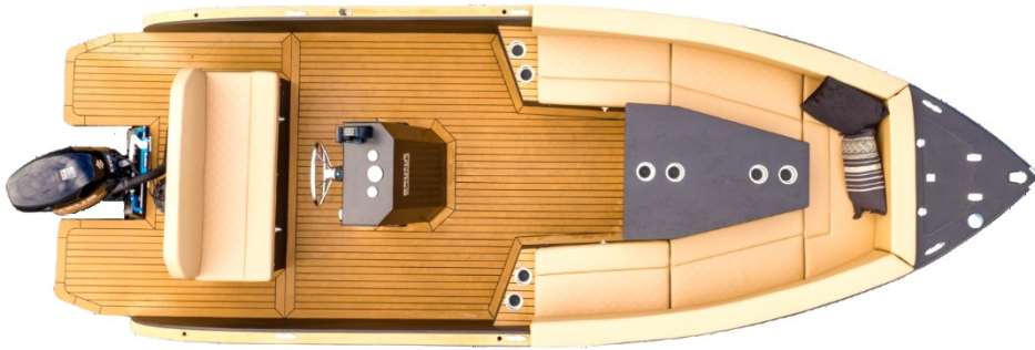
Futuro ZX20 Sport